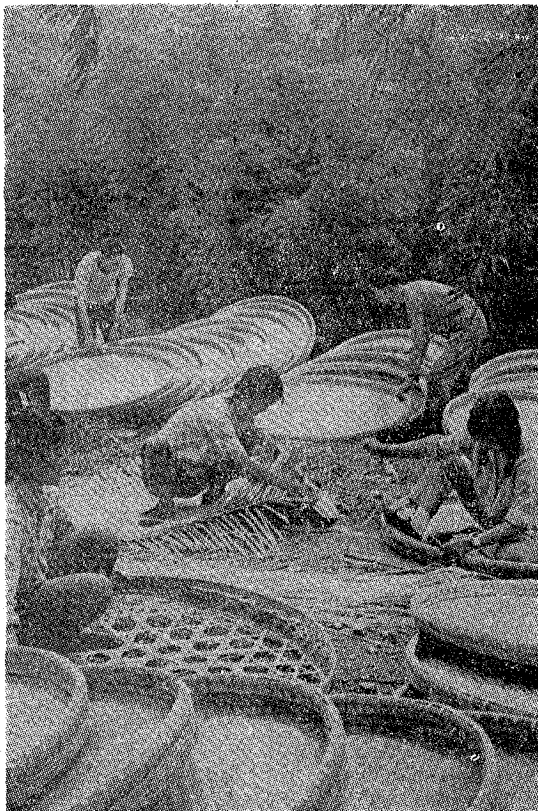
Сл. 2. Рачна изработка на предмети од бамбус

виот мебел. Друг вид мебел кој се сретнува е бамбусовиот, кој се одликува со едноставна и грациозна линија, но, е со многу помала употребна вредност.